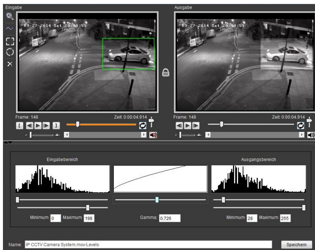
Beispiel: Level Adjust Filter

Mit den Filtern Graustufen, Schärfen, Blur (Verwischen), Stabilisieren, LevelAdjust sind alle wichtigen Funktionen vorhanden, um das Video-/Bildmaterial direkt zu verbessern und auszuwerten (Links das Original, Rechts das Bearbeitete, bei allen Modulen die zur Verfügung stehen).