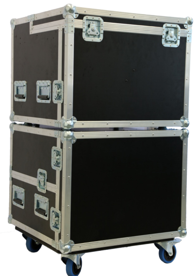
Option: PIC Hoolifix als portable Anlage im transportgerechten Rack