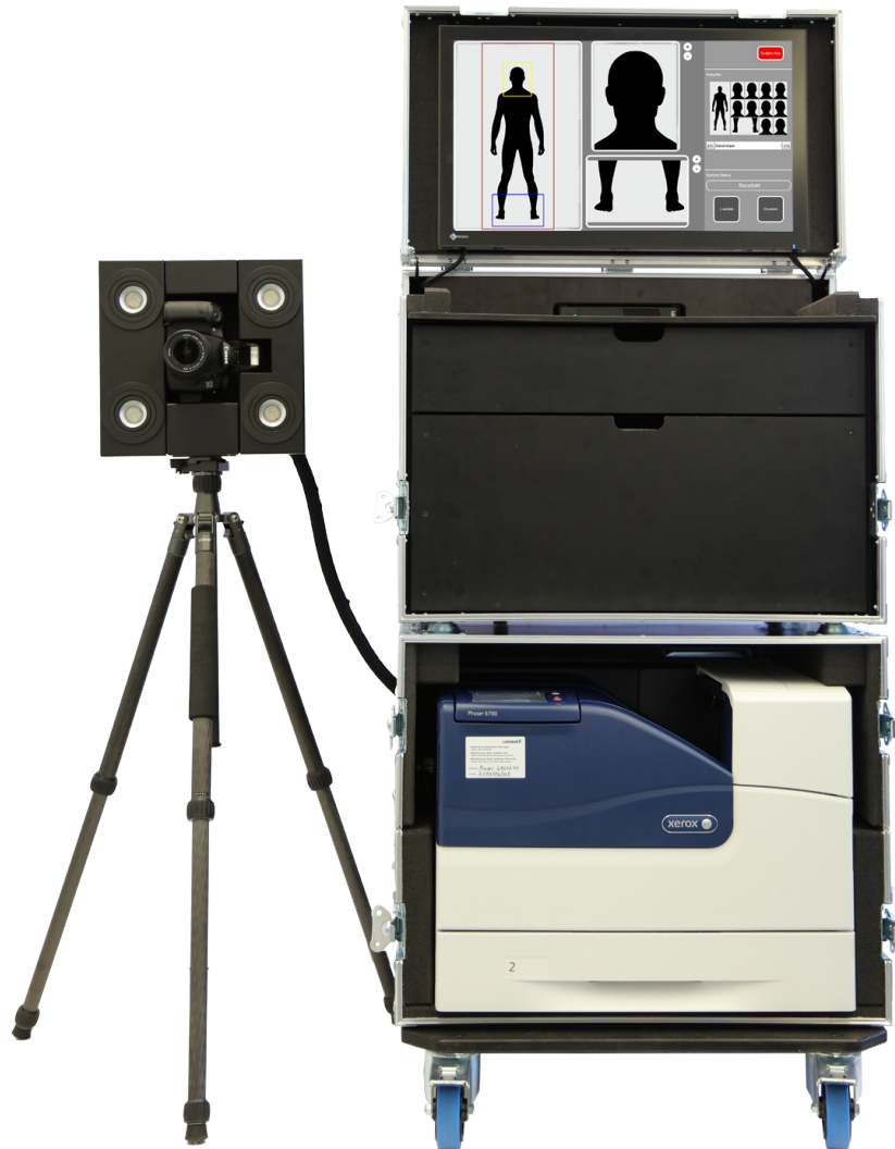
PIC HooliFix (Portable Variante im Rack)

Das System eignet sich sowohl für Festinstallationen mit Einbindung von Blitzanlagen, wie auch als portable Anlage für Einsätze an Demonstrationen oder anderen Massenveranstaltungen.